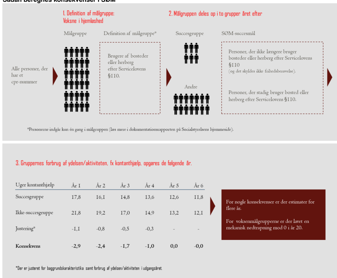
Figur 2.1 Sådan beregnes konsekvenser i SØM

Begge grupperes forbrug af offentlige ydelser og aktiviteter, fx antal uger på kontanthjælp, følges i årene efter, at målgruppen opdeles i forhold til opnåelse af succesmålet. Forskellen i forbruget af offentlige ydelser og aktiviteter imellem succesgruppen og gruppen, der ikke opnår succes, justeres i statistiske regressioner for systematiske forskelle, fx køn og alder.